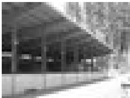
Hangar à copeaux

Ne voulant plus s'occuper de la commercialisation du bois déchiqueté, l'association La Forestière a décidé de se séparer du dépôt qu'elle a construit en 1992 sur un droit de superficie accordé par notre commune. Afin de garantir le bon usage de ce bâtiment, situé en zone forestière, la Municipalité a estimé souhaitable de devenir propriétaire. La gestion de la vente de ces copeaux en bois dur est assurée par le Triage forestier de la Menthue, qui s'occupe de développer le marché tant au niveau des plaquettes de chauffage que pour les aménagements extérieurs.