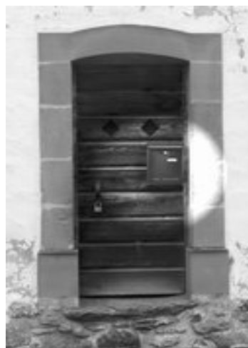
La porte du Turlet avec la boîte aux lettres de Vivre à Poliez