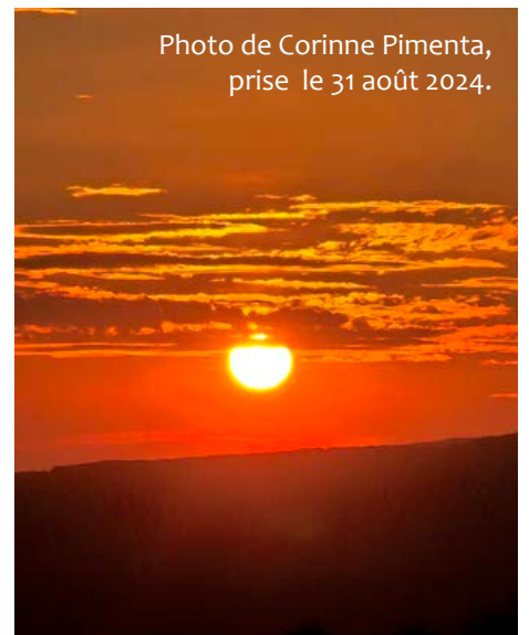
prise le 31 août 2024.