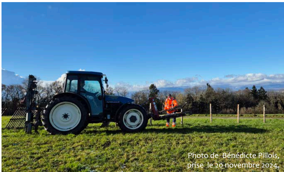
prise le 20 novembre 2024.